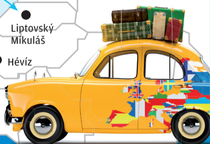
Ilustrace Shutterstock / šk

Zdroj: Evropská komise, přepočten LN Vyrobeno ve spolupráci s ÚAMK