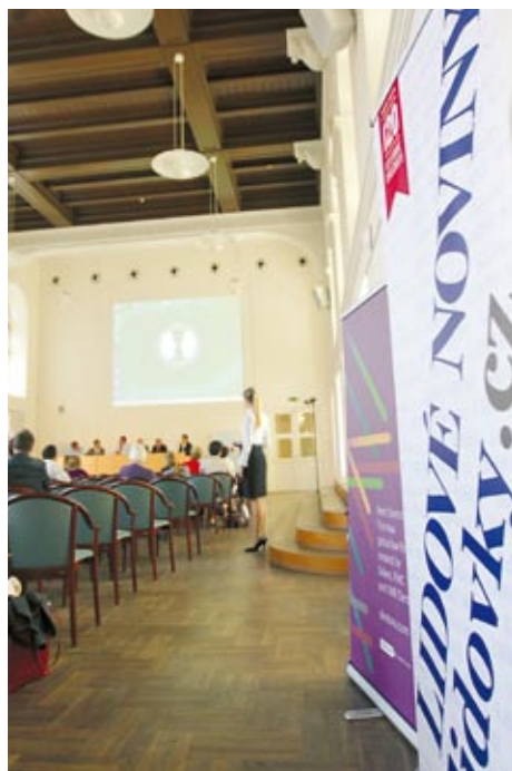
Konference v aule Fakulty sociálních studií MU

Dívala jsem se ale na text slovenského zákona i z pohledu bývalé advokátky. Hovoří se tam o soudci, nikoli o představiteli jiných státních orgánů, jako je například