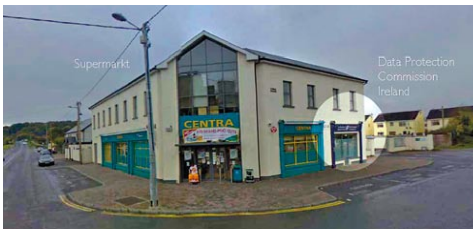
Irský úřad pro ochranu osobních údajů, dozírající na evropské podnikání Facebooku